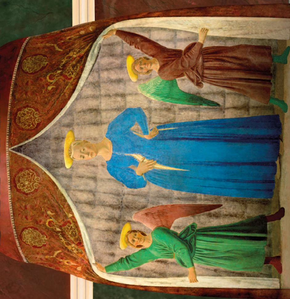
LA MADONNA DEL PARTO